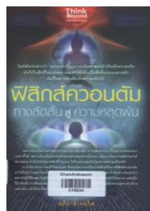
พิลึกส์ควอนตัมทางลัดสั้นสู่ความหลุดพ้น 530.12 อ267ฟ 2558