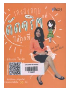
แก่งอังกฤษแค่ตัดจริดให้ถูกที่ 425 ค167ก 2558